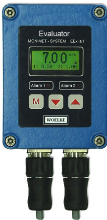
Auswertegerät Typ GMM 30.00.5xx im Metallguss-Gehäuse